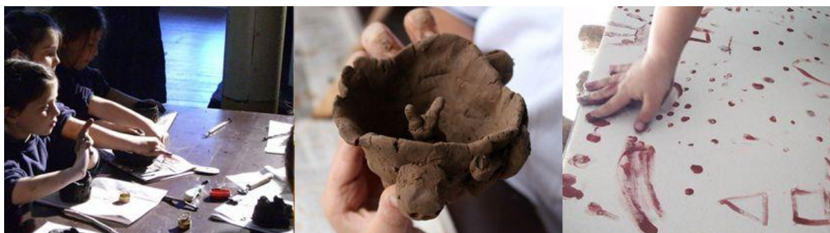
Programa educativo del MAPI 2014: www.mapi.uy

El MAPI - Museo de Arte Precolombino e Indígena y la Cámara Uruguaya del Libro tienen el honor de trabajar en conjunto por vez primera, en el marco de la 14ª Feria del Libro Infantil y Juvenil. El MAPI contará con un espacio en el Atrio donde presentará una propuesta museográfica especialmente diseñada para la ocasión. Además, exhibirá parte de su producción editorial y ofrecerá una programación especial con actividades en el piso 1 y medio.