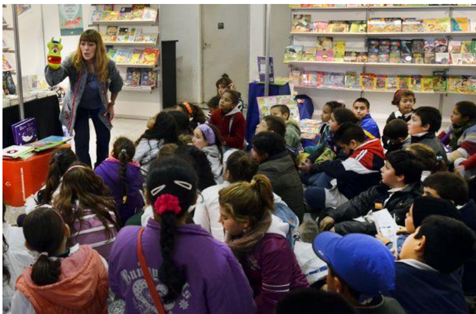
Cuentacuentos, actividad 2013.

Contaremos con un espacio especialmente diseñado para sumergirse en diversas aventuras gracias a la participación de cuentacuentos y narradores que compartirán sus relatos.