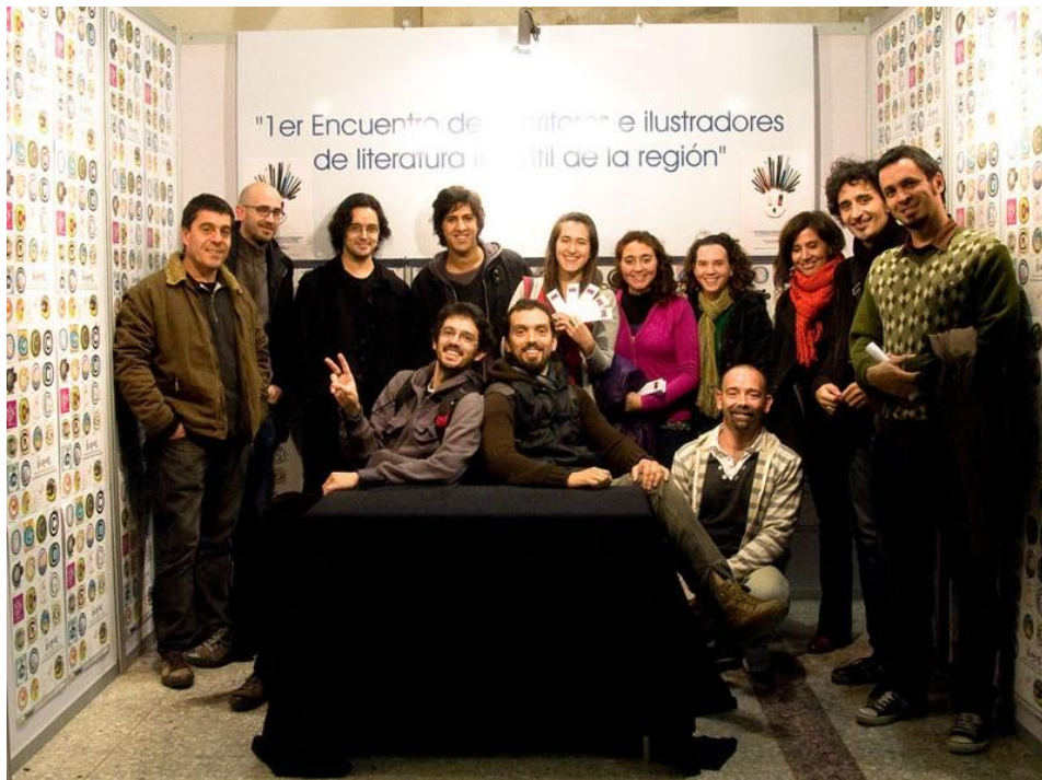
1er encuentro de Escritores e Ilustradores, 2012.