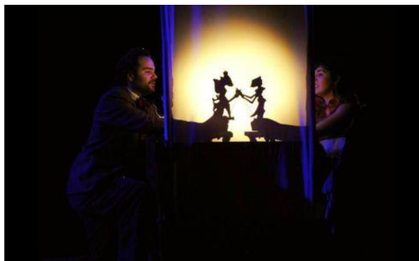
Colectivo La Tijera