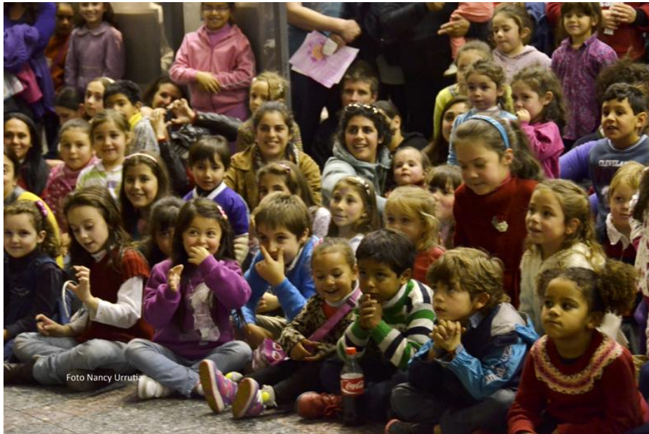
13ª Feria del Libro Infantil y Juvenil.

En esta edición, inauguramos la Feria festejando el 26 de mayo Día Nacional del Libro, con muchas actividades, próximamente informaremos todas las novedades. Además, sumamos al predio ferial el foyer del piso 1 ½ como espacio de aprendizaje, juego y encuentro.