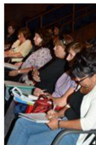
9ª Jornadas de Educación, 2013.

Las charlas, talleres y conferencias estarán a cargo de referentes a nivel local y regional de varias disciplinas, servirán para enriquecer los distintos enfoques de los participantes, propiciando el encuentro, intercambio y debate entre los docentes, autoridades y trabajadores del libro.