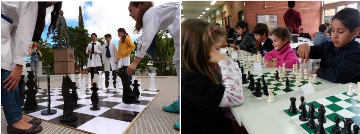
Programa Ajedrez para la convivencia, actividad 2013.

Ajedrez para la Convivencia es un Programa del Ministerio de Educación y Cultura que promueve la creación de una Red de Proyectos de Ajedrez Educativo y Social, con el fin de facilitar que la comunidad toda pueda apropiarse de este noble bien cultural. En este marco, participarán de la Feria propiciando un espacio de esparcimiento, comunión y aprendizaje, realizando campeonatos de ajedrez con premios extraordinarios para los ganadores y compartiendo muchos otros juegos vinculados al ajedrez, favoreciendo un espacio inclusivo, para el disfrute de los niños, jóvenes y adultos.