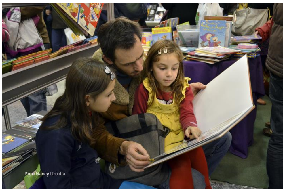
13ª Feria del Libro Infantil y Juvenil.

La Feria del Libro Infantil y Juvenil tiene como objetivo promover el hábito de la lectura entre los niños y jóvenes; reunir a editores, librerías, distribuidores, bibliotecarios, docentes y especialistas; compartir y confrontar experiencias, promover el intercambio y acercar al público las ediciones nacionales e internacionales facilitando su acceso.